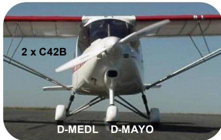
2 x C42B