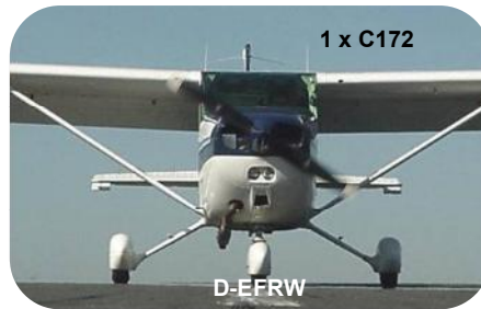
1 x C172