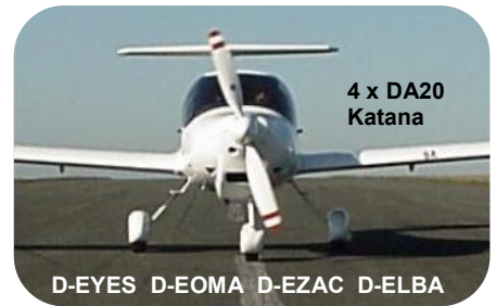
4 x DA20 Katana