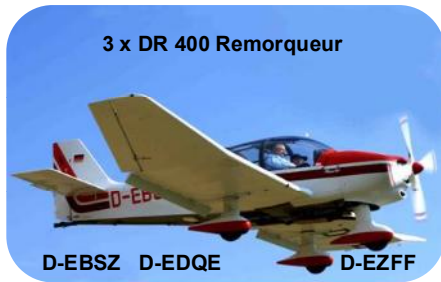
3 x DR 400 Remorqueur

Diese 18 (!) Flugzeuge werden wieder für Sie bereit stehen: