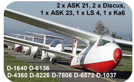
2 x ASK 21, 2 x Discus, 1 x ASK 23, 1 x LS 4, 1 x Ka6

D-1640 D-6136 D-4360 D-8226 D-7806 D-6572 D-1037