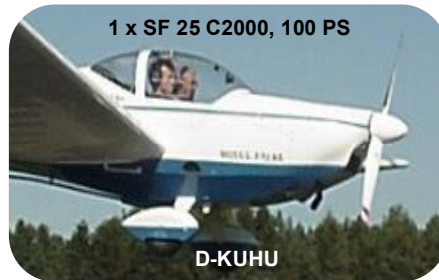
1 x SF 25 C2000, 100 PS